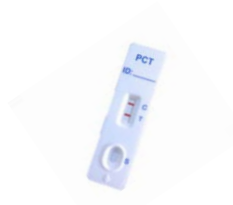
Test qualitativo da sangue intero POCT - Lateral Flow - cut-off 1 ng/ml