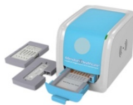
Test quantitativo da sangue intero su analizzatore POCT LF QUANTI® READER